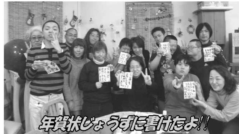
年賀状じょうずに書けたよ!!