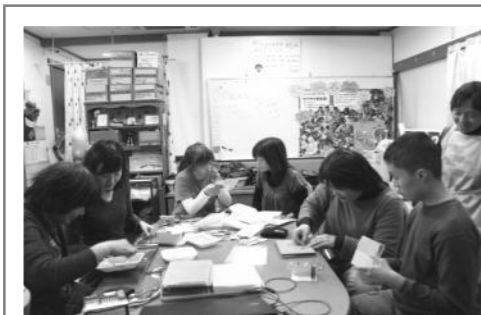
↑ヘルパーさんと参加した写真サークルの活動で、自分の写真集を作ってます!!