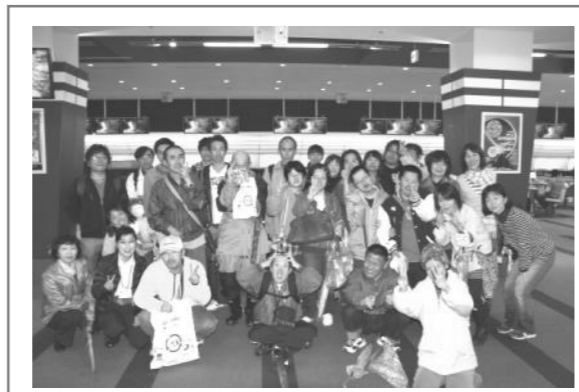
↑ボウリング大会をした時の記念撮影です。他にも花火大会やバーベキューなどにもいっぱいの利用者さんが参加しています。みんなのよこぶ笑顔が最高にうれしいです!!

ヘルパーさんと大阪くらしの今昔館に行ったとき、友達と一緒に着物を着て楽しかったし、ヘルパーさんから何度も「かわいいね」と言ってくれてうれしかった!!