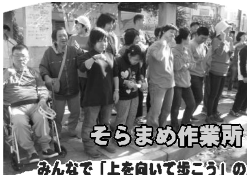
そらまめ作業所 みんなで「上を向いて歩こう」の手話歌を披露しました

11月とは思えない程の暖かい日作業所や教会の平和を願う団体・個人が集い・ゲーム・バザー・模擬店・舞台上狭い公園が活気づきました。