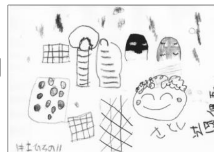
思い出を絵にしてくれました

マイクロバス4台を連ねて今年も自然を味わってきました。障がい者も家族も登山のかたも歳を重ね・・・キリのいい30回を迎えて、そろそろこの実行委員会も解散か？という空気の漂う中、秋が近づくと みんな当たり前のように今度はどこ行くん？ぶた汁あるの？という声が聞こえてきます。というわけで誰かが今回で止めよう！というまで続きそうです。晴天の中のんびり歩いて、ぶた汁食べて・菓子くい競争で盛り上がり、交流を深めた1日でした。おつかれさま！