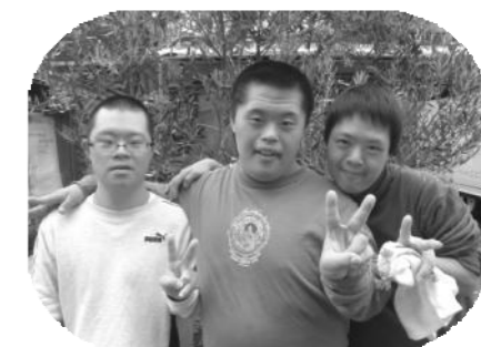
ぼくたち甲山に登ってきました